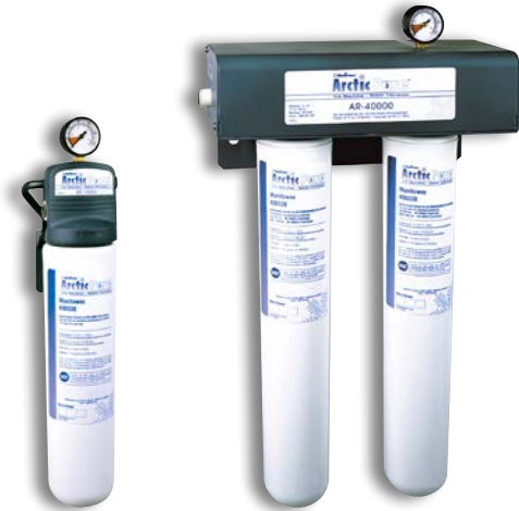
Arctic Pure 10000